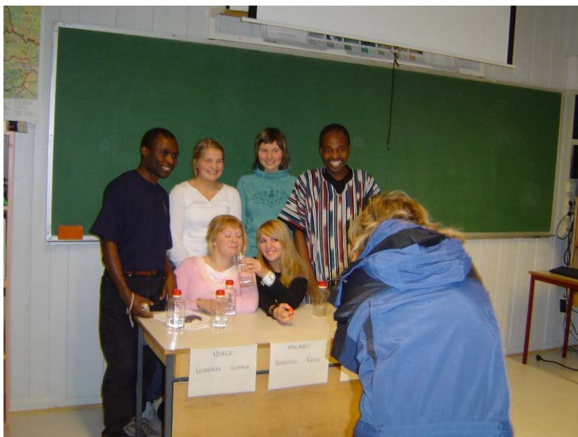
Journalisten tar bilde av vannprøvene og noen i klassa

Powerpoint-presentasjon er tilgjengelig i pdf-format via Skolens deltakerside hos miljolare.no http://miljolare.no/data/ut/deltaker/?d_id=3251