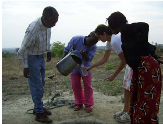
Kine får hjelp til å fylle vannflaska i Kasungu

Vi målte pH, oksygeninnhold, fosfatinnhold, registrerte utseende og lukt, og så telte vi bakterier. Det var særlig for bakterieinnholdet vi fant store forskjeller på malawisk og norsk drikkevann.